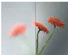
Clearvision Extra helder floatglas voor een zuivere esthetiek