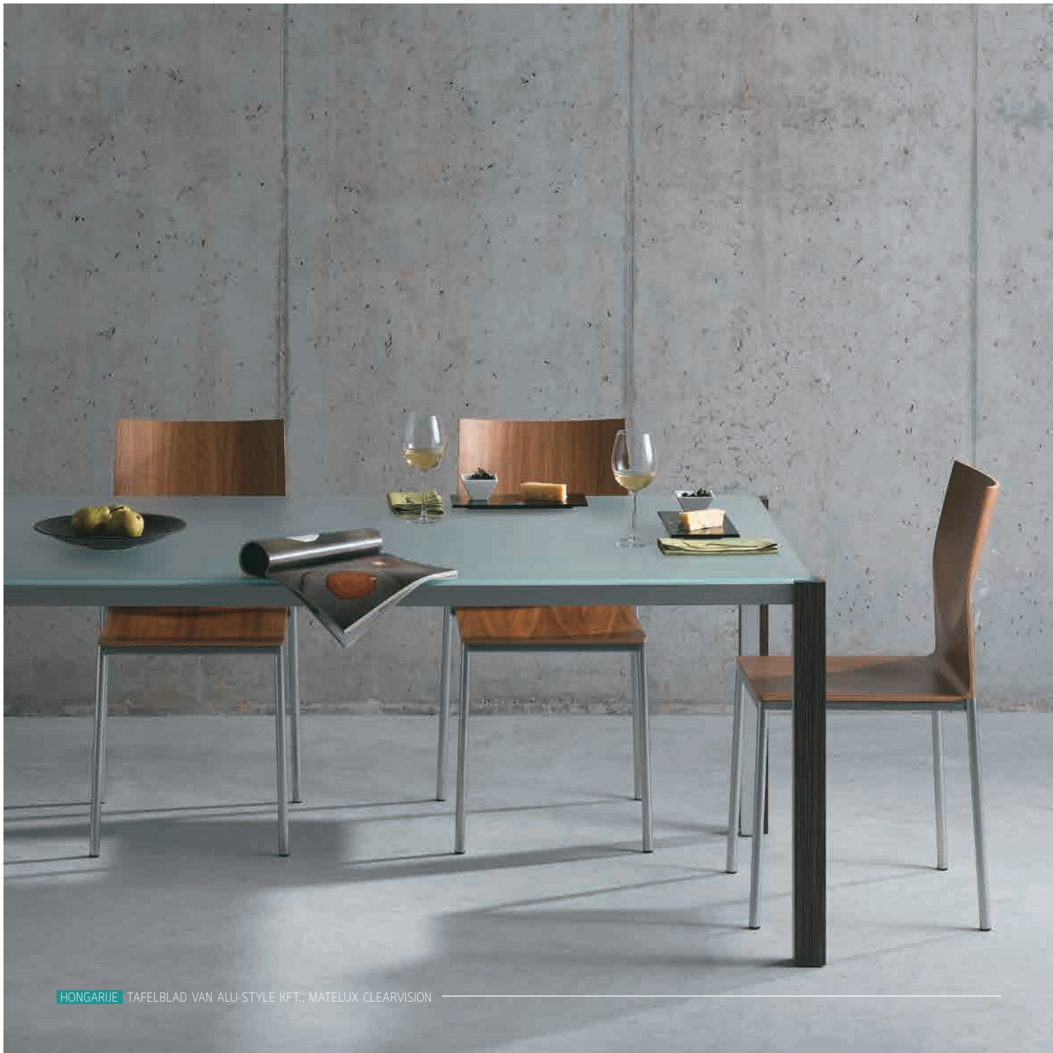
HONGARIJE TAFELBLAD VAN ALU-STYLE KFT., MATELUX CLEARVISION